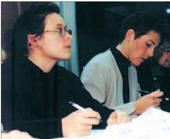
Die Erwachsenenbildung muss sich heute verstärkt dem Bildungsmarketing unterwerfen, um zielgruppenorientierte Angebote schaffen zu können.

unter das Thema „Bildungsmarketing - zielgruppenorientierte Planung für Weiterbildungseinrichtungen“, informiert Mag. Wolfgang Türtscher, der Vorsitzende der ARGE Vorarlberger Erwachsenenbildung (ARGE EB). „Diese findet am 23. September 2005 von 13 - 18:30 Uhr